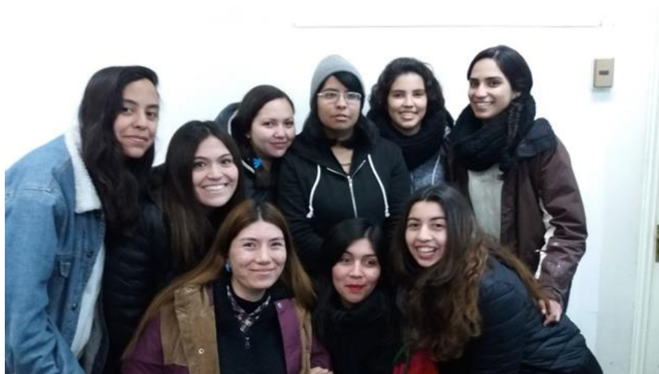
Estudiantes de Experiencias Laborales I